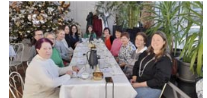
Brunch für die treuen Helferinnen des Vereins.

Welt des StartUps in diesem Forschungsbereich und war wirklich sehr beeindruckend.