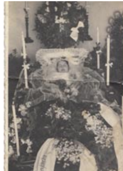
Eine offen aufgebahrte Verstorbene vom Gutshof/Post