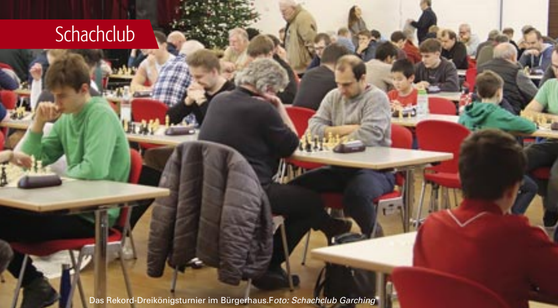
Das Rekord-Dreikönigsturnier im Bürgerhaus.