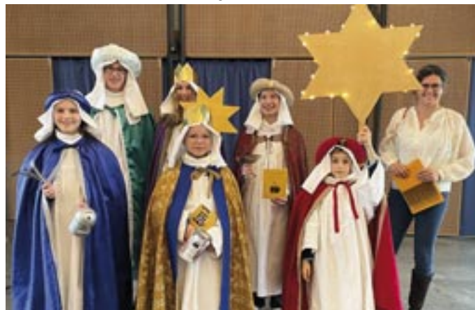
Die Sternsingergruppe sang beim Neujahrsempfang und bat um Spenden für Kinder. Insgesamt beläuft sich das Sammelergebnis der Sternsinger auf fast 4000 Euro für das Kindermissionswerk.