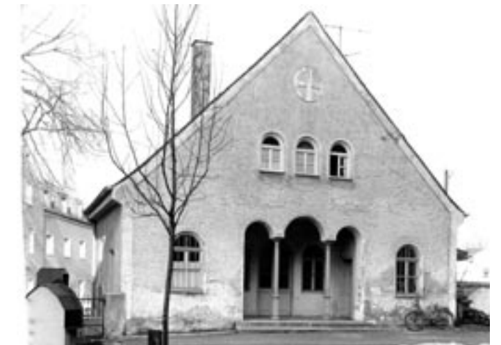
Oben: Das Leichenhaus von 1923 vor dem Umbau in 70-Jahren. Unten: Nach dem Umbau in den 70er Jahren von Süden her.

Aus Platzmangel bei mehreren gleichzeitig abzustellenden Särgen mit den Verstorbenen, Stadtfriedhof durchgeführt.