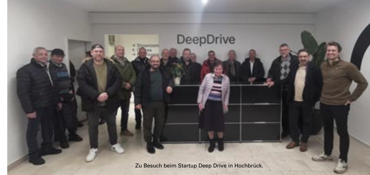
Zu Besuch beim Startup Deep Drive in Hochbrück.

Am letzten Sonntag 2024 hat der MSC Garching die Backkünstlerinnen unter den Mitgliedern, die bei den Oldtimertreffen jeweils ein Kuchenbuffet auf die Beine stellen, zum Dank zu einen Brunch im Palmenhaus von Schloss Nymphenburg eingeladen. Hier konnte sich die fröhliche Truppe einmal so richtig verwöhnen lassen. Zum Abschluss gab es noch ein letztes Glas Sekt im Freien bei strahlender Wintersonne. Etliche Vereinsmitglieder besuchten zusammen die Night of Freestyle in der Münchner Olympiahalle. Es war ein unglaubliches Action-Event mit spektakulären Stunts und Tricks mit Motocross-Maschinen, Mountainbikes, BMX-Rädern, Snowmobilen, Quads und Buggys, die alle begeistert haben. Auch ein Besuch im Fahrerlager,