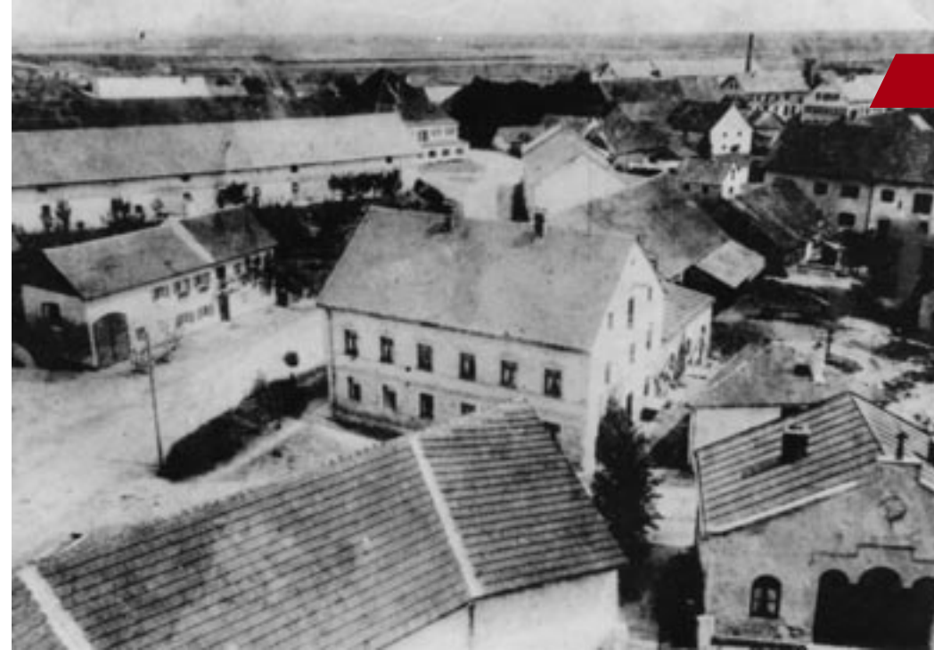
Blick vom Kirchturm nach Norden mit dem „Kramerhaus“, heute Volksbank/Raiffeisen und unten rechts das Leichenhaus.

Der Stadtspiegel erscheint monatlich und wird kostenlos verteilt; die Verteilung erfolgt durch den Verlag oder Verlagsbeauftragte. Durch Namen kenntlich gemachte Artikel geben nicht zwingend die Meinung der Redaktion wieder. Der Verlag übernimmt keine Haftung für unverlangt eingesandte Manuskripte oder sonstiges Material. Die Redaktion behält sich vor, Zuschriften und Artikel zu kürzen. Namens seiner Autoren behält sich der Stadtspiegel Verlag für alles in dieser Zeitschrift veröffentlichte Text- und Bildmaterial sowie Anzeigenvorlagen sämtliche Nutzungsrechte vor. Reproduktion des Inhalts, ganz oder teilweise, nur mit schriftlicher Genehmigung des Verlages. Der Verlag übernimmt keinerlei Haftung für den Inhalt von Anzeigentexten. Der Stadtspiegel wird auf zu 100 Prozent chlorfrei hergestelltem Papier gedruckt – der Umwelt zuliebe.