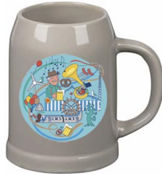
Der Krug zur Bürgerwoche 2024.

Eine Jury aus Politik und Stadtprominenz wird alle eingereichten Vorschläge werten. Die Siegerentwürfe werden in der Mai-Ausgabe des Stadtspiegels präsentiert.